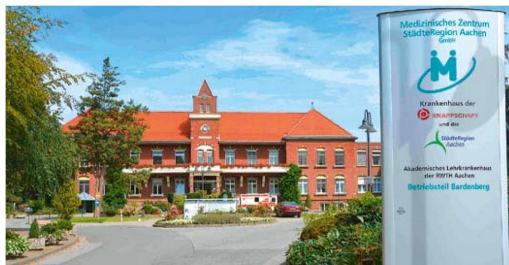
Das Medizinische Zentrum StädteRegion Aachen GmbH entstand aus dem Zusammenschluss des Knappschaftskrankenhauses Bardenberg (im Bild) und des Kreiskrankenhauses Marienhöhe und versorgt heute jährlich rund 25.000 Patienten (stationär).