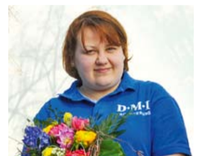
Die Zahl der Mitarbeiter wächst mit dem Erfolg des Unternehmens: Begrüßung der 500. DMI Teamkollegin

Der Archivdienstleister setzt auf neue Technologien – und die Krankenhäuser nehmen diese Strategie an. Für die positive Unternehmensentwicklung steht auch aktuell eine Zahl: Im März stellte DMI die 500. Mitarbeiterin ein.